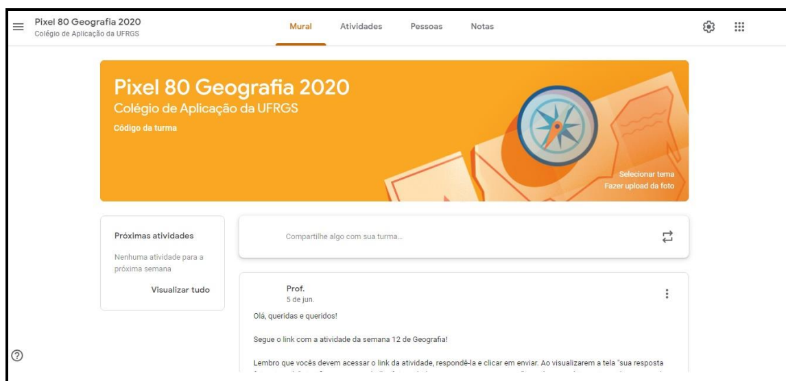
Figura 5 – Exemplo de Sala de Aula Virtual – Google Classroom