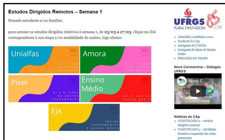
Figura 2 – Tela por Equipe de trabalho